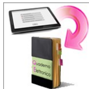
Acquisizione dei dati dall'Account in Quaderno Elettronico