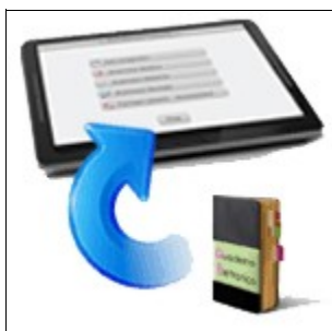
Caricamento dei dati da Quaderno Elettronico verso l'Account

Il sistema di compilazione anamnesi è un servizio online e per il suo utilizzo è necessario disporre di una connessione ad Internet. Per comprendere il sistema di funzionamento del servizio, possiamo dividere il processo in tre eventi fondamentali: