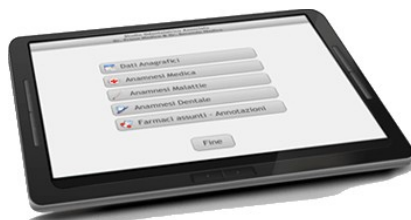
Compilazione / Revisione dei dati attraverso il Tablet